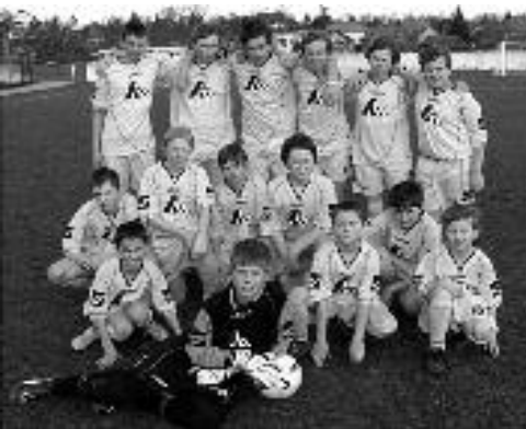
Žiacke futbalové mužstvo (stále na čele tabuľky)