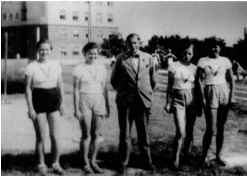
Atlétky VŠ Bratislava - Lafranconi 1936