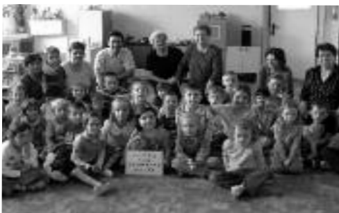
Miestny spolok SČK Trstín realizoval ďalšie pokračovanie projektu "Evička nám ochorela"